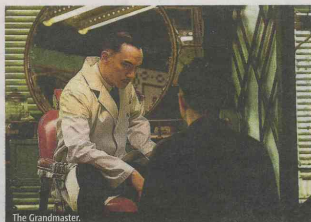
The Grandmaster .

Tapahtuman avainelokuviin kuuluvat muun muassa Pirjo Honkasalon odotettu uutuudraama Betoniyö , Wong