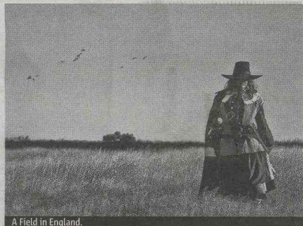
A Field in England .

–Kirjan päähenkilö kuolee israelilaisten iskiessä moskeijaan. Khadra suuttui minulle, kun muutin lopun paljon avoimemmaksi.