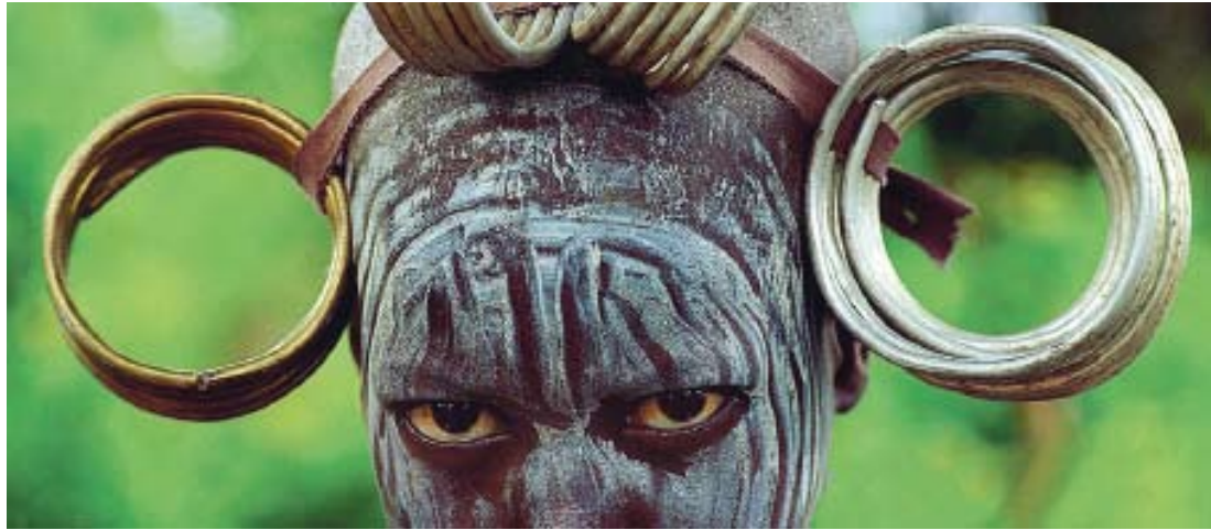
Rakkautta ja anarkiaa -elokuvalifestivaalilla esitettävä Ron Fricken Samsara on visuaalisesti hurjaa tykitystä.